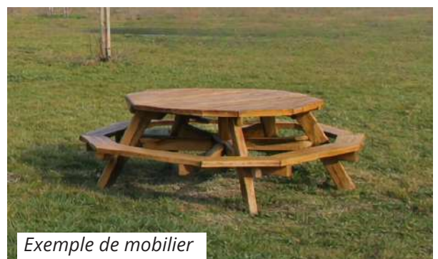
Exemple de mobilier

Cet aménagement a pour objectif de faire de cet espace naturel un lieu convivial et accueillant, propice aux moments de détente et aux échanges entre habitants. Les familles pourront ainsi profiter d'un cadre agréable pour se retrouver, partager un repas ou simplement passer du temps ensemble en plein air.