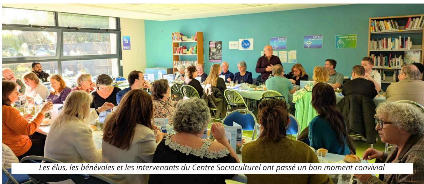
Les élus, les bénévoles et les intervenants du Centre Socioculturel ont passé un bon moment convivial