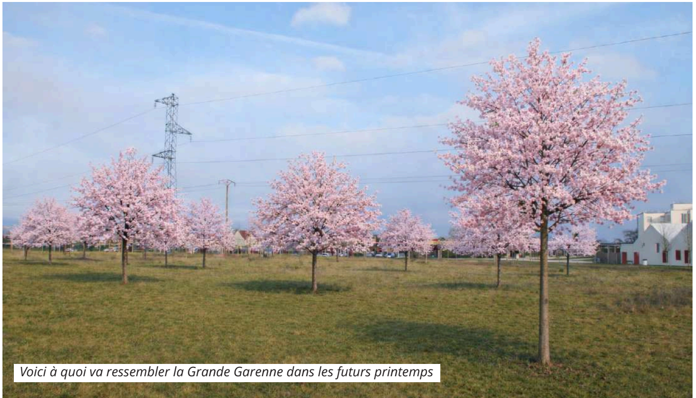
Voici à quoi va ressembler la Grande Garenne dans les futurs printemps