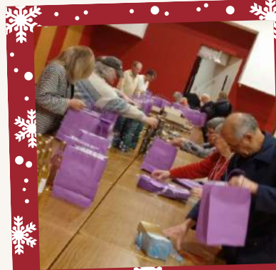
Confection des colis de Noël par les élus et les bénévoles