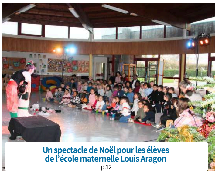
Un spectacle de Noël pour les élèves de l'école maternelle Louis Aragon