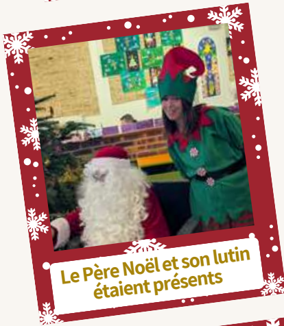
Le Père Noël et son lutin étaient présents