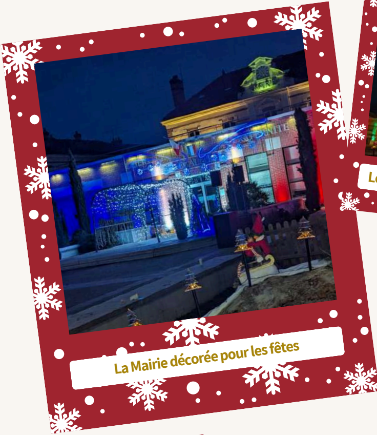
La Mairie décorée pour les fêtes