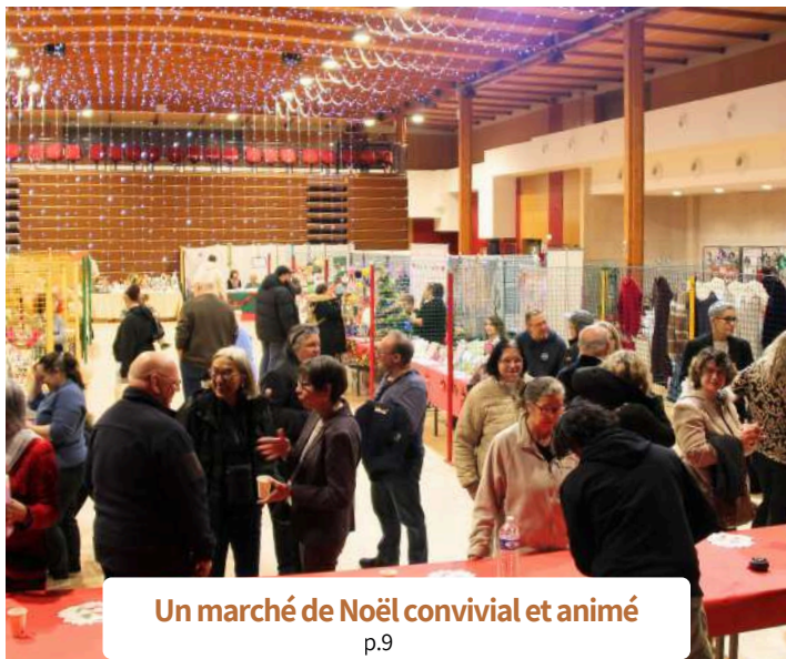
Un marché de Noël convivial et animé