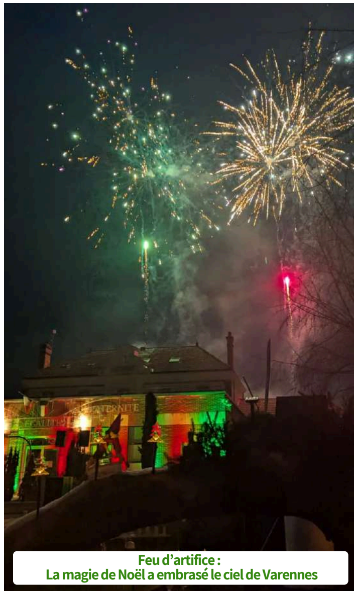
Feu d'artifice : La magie de Noël a embrasé le ciel de Varennes

PLU - Bientôt la fin de la consultation pour l'extension de Prysmian