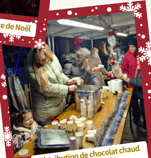
Distribution de chocolat chaud pour les enfants