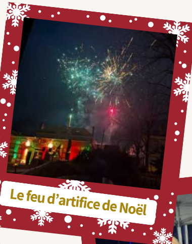
Le feu d'artifice de Noël