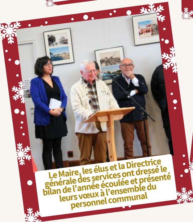
Le Maire, les élus et la Directrice générale des services ont dressé le bilan de l'année écoulée et présenté leurs vœux à l'ensemble du personnel communal