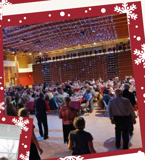
Repas de fêtes offert par la municipalité pour nos Séniors