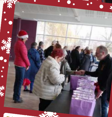
Distribution des colis de Noël aux séniors