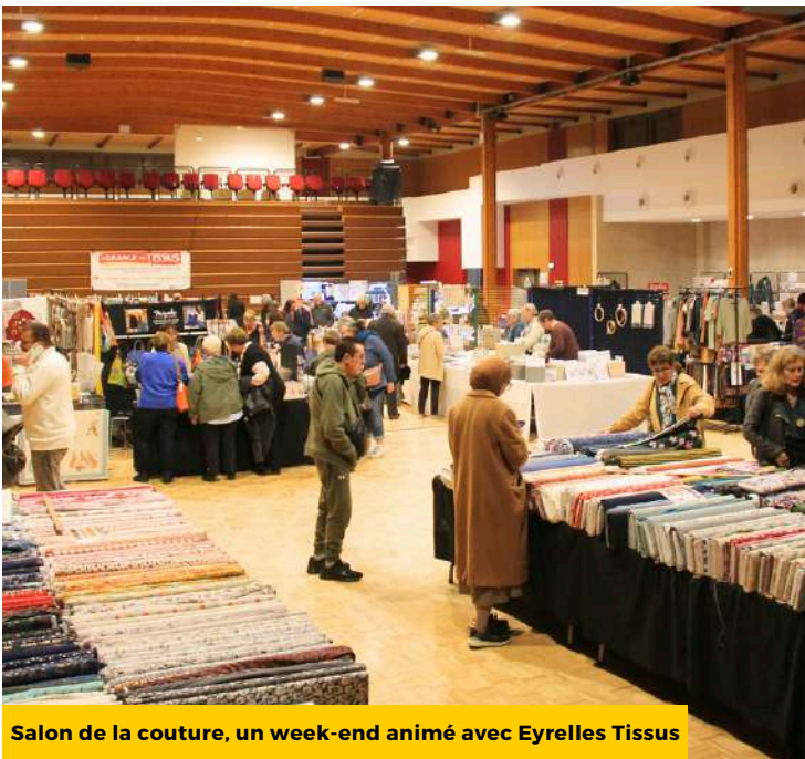
Salon de la couture, un week-end animé avec Eyrelles Tissus