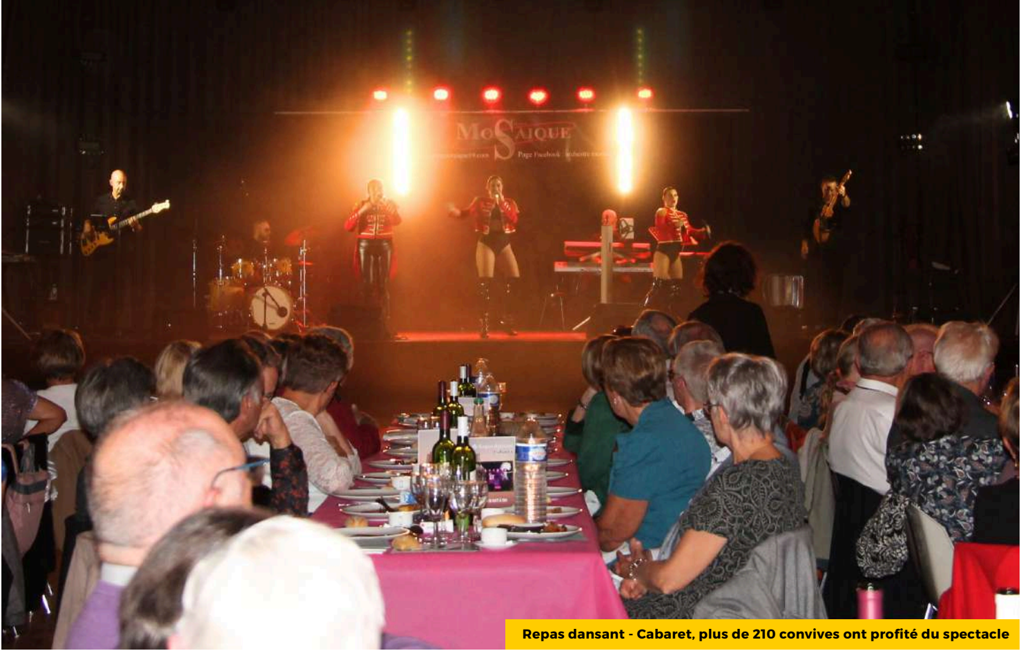
Repas dansant - Cabaret, plus de 210 convives ont profité du spectacle