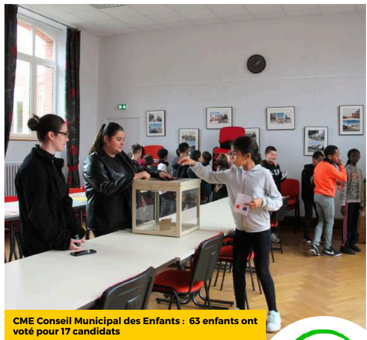
CME Conseil Municipal des Enfants : 63 enfants ont voté pour 17 candidats