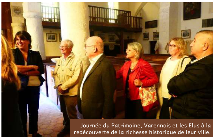
Journée du Patrimoine, Varennois et les Elus à la redécouverte de la richesse historique de leur ville.