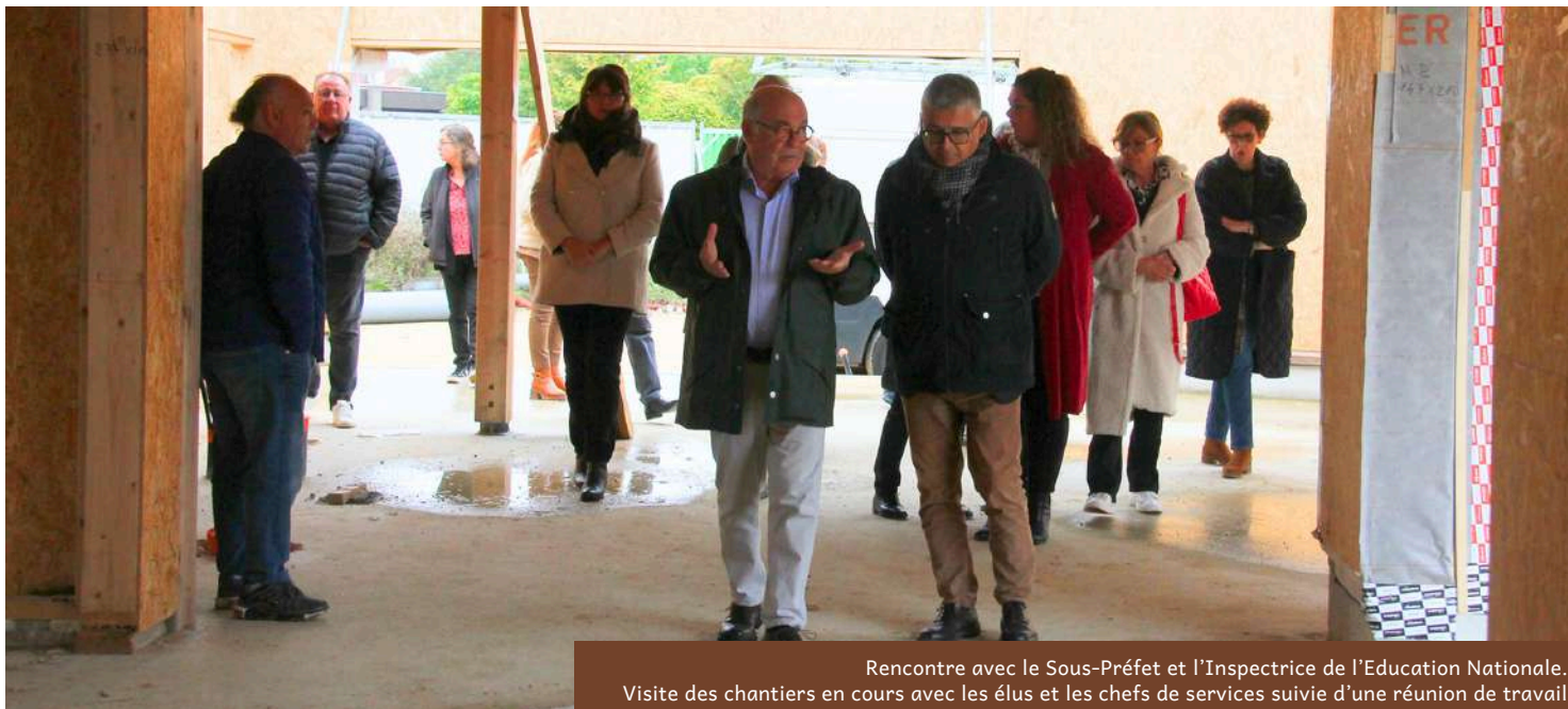
Rencontre avec le Sous-Préfet et l'Inspectrice de l'Education Nationale. Visite des chantiers en cours avec les élus et les chefs de services suivie d'une réunion de travail.