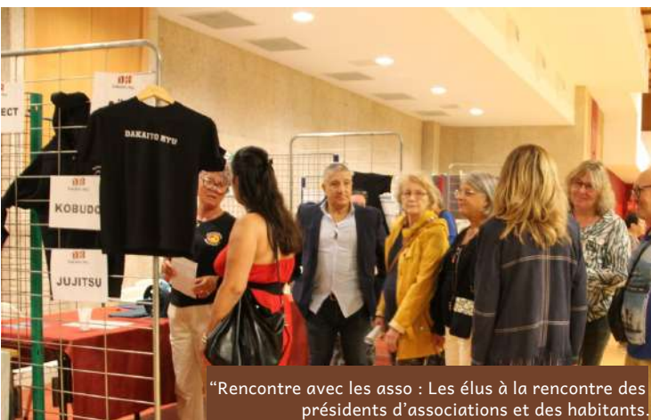
“Rencontre avec les asso : Les élus à la rencontre des présidents d'associations et des habitants.