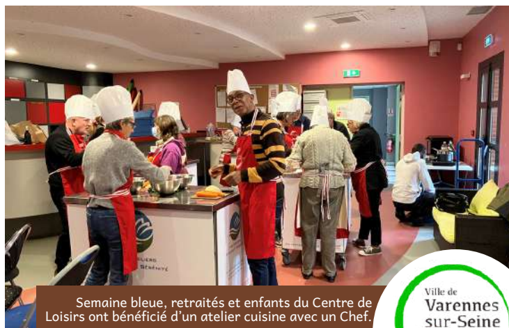
Semaine bleue, retraités et enfants du Centre de Loisirs ont bénéficié d'un atelier cuisine avec un Chef.