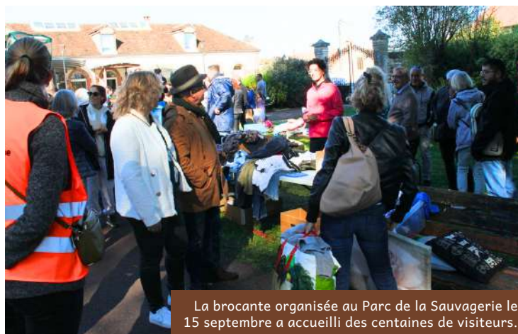
La brocante organisée au Parc de la Sauvagerie le 15 septembre a accueilli des centaines de visiteurs.