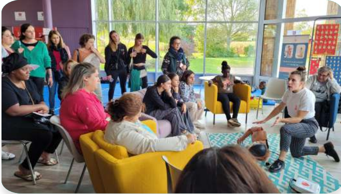
Atelier gestes de premiers secours