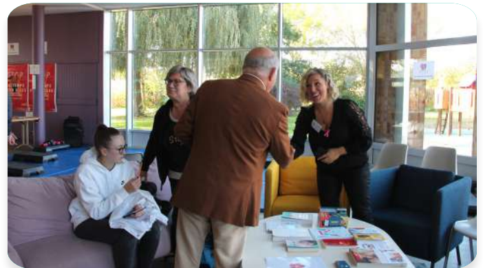
Le Maire et les élus saluent les intervenantes

Retrouvez toute l'actualité du « Cercle des Meufs » sur Instagram et Facebook ! D'autres évènements arrivent prochainement !