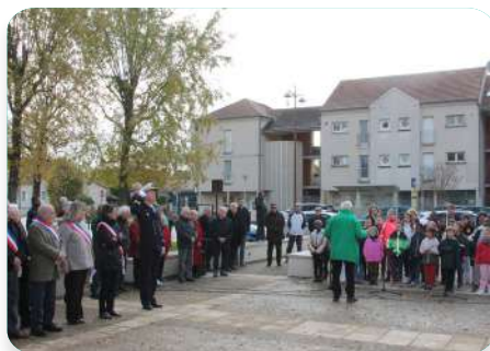
Les enfants interprétant la Marseillaise accompagnés de la fanfare Varennoise

Ce samedi 11 novembre, le Maire, les élus, les élèves de l'école élémentaire, leurs parents et les personnalités se sont réunis pour rendre hommage à tous ceux qui ont sacrifié leur vie pour la liberté, en ce jour historique du 11 Novembre 1918.