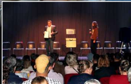
Les Varennois se sont essayés à l'hypnose