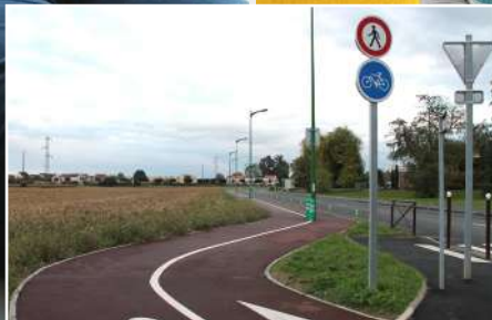
Empruntez les chemins de mobilités douces de Varennes