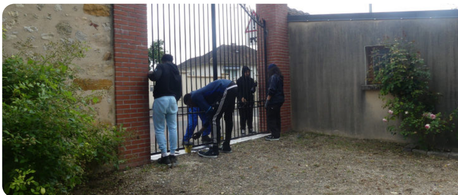
Les jeunes repeignent les grilles du Parc de la Sauvagerie.

Ce dispositif sera sans doute renouvelé par la municipalité.