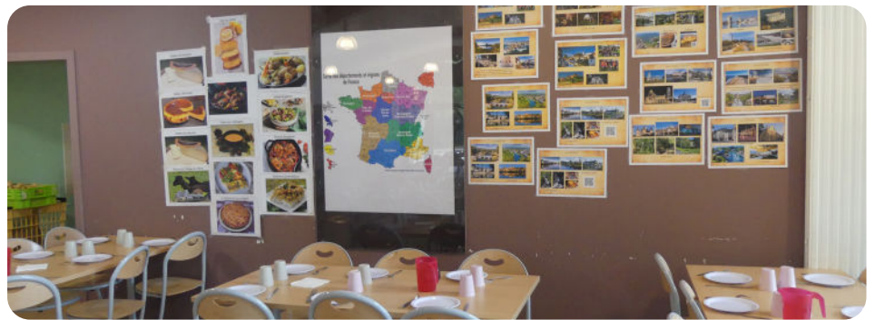
La carte des régions de France et leurs spécialités affichées à la restauration scolaire.

En parallèle, l'équipe du Centre de Loisirs interviendra le mercredi auprès des enfants en proposant des activités, des jeux, de la musique, des ateliers pâtisseries... autour de ces régions.