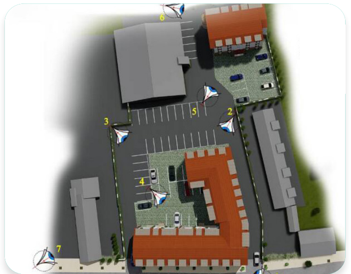
Plan du projet Route de Cannes.