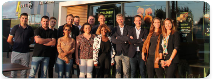
L'équipe du Groupe Axiom et les employés de la boulangerie.