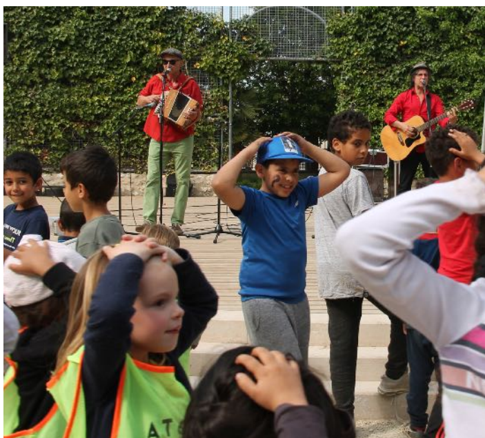
Bal des coquins