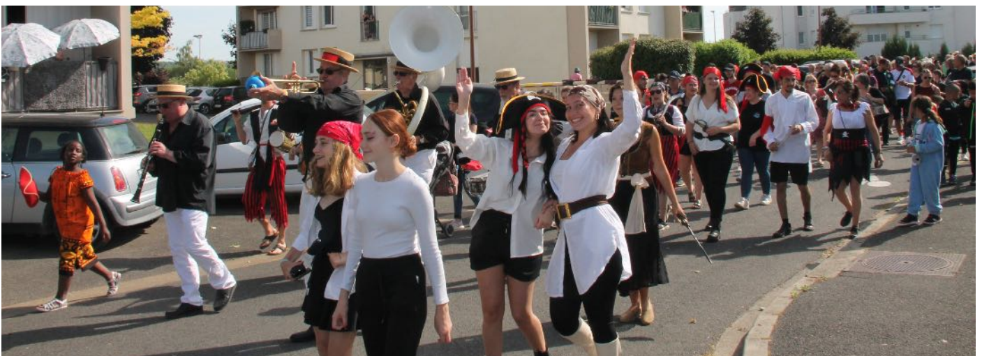
Défilé des pirates dans les rues de Varennes