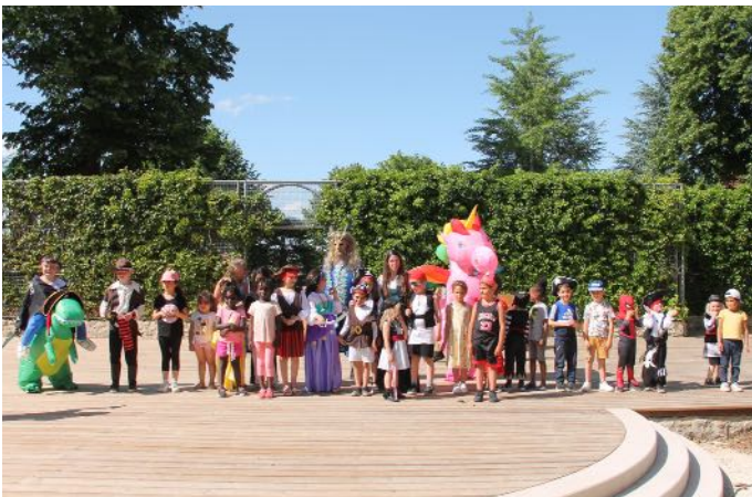
Concours de déguisement