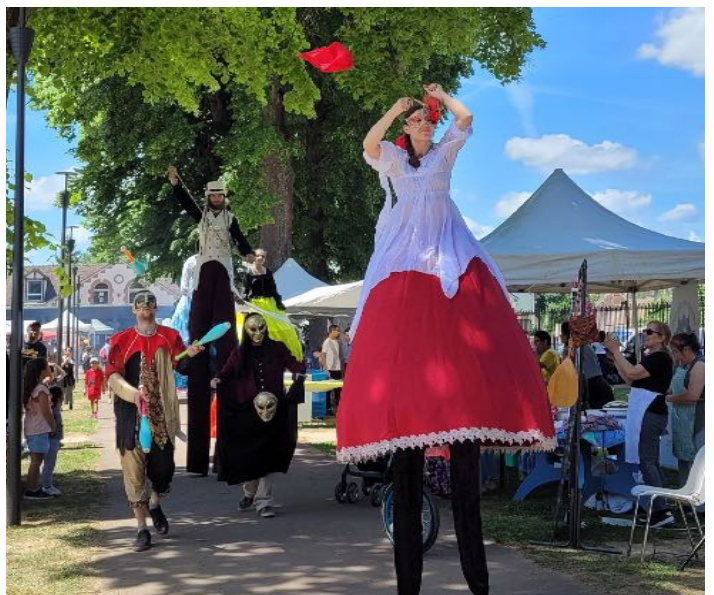
Déambulation des "Chroqueurs de Pavés"