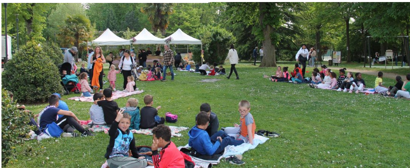
Pique-Nique sur l'herbe