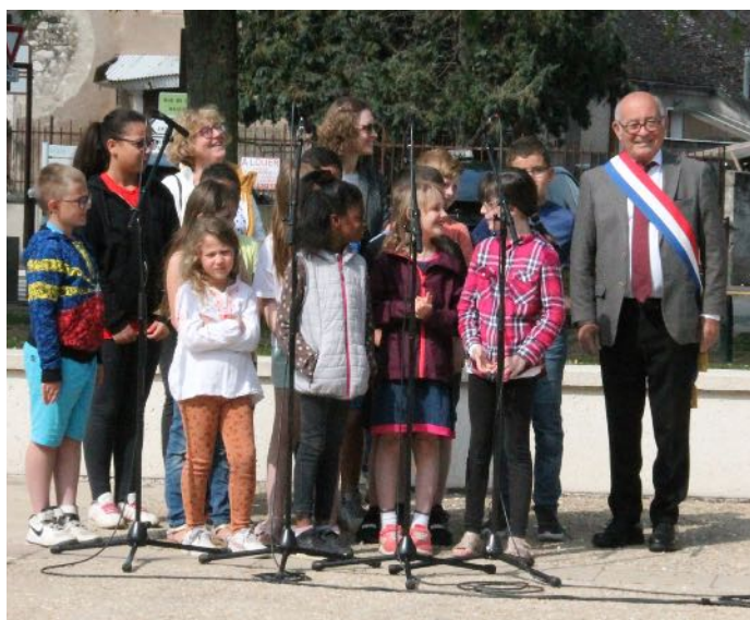
Les enfants de l'école Louis Pasteur ont chanté la Marseillaise

Et toute cette histoire, notre histoire commune est là pour nous aider à affronter notre présent.