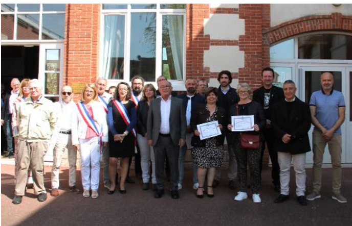
Cérémonie du 1 er mai