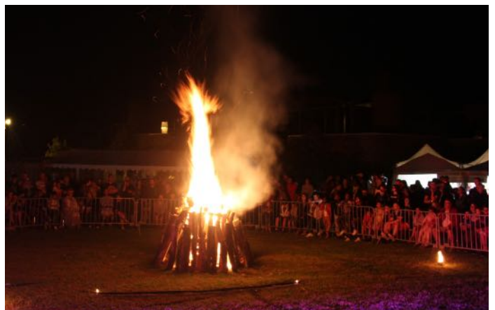
Varennnes en fêtes : vive le feu de la Saint Jean !