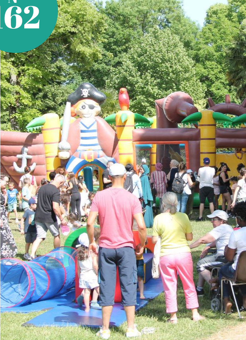
Festival du jeu une affluence record !