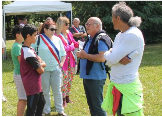
Le Maire et les élus à la rencontre des Varennois lors du Festival du Jeu