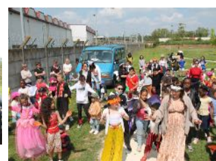
Défilé des roues fleuries