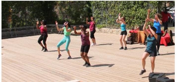
Démonstration de Zumba