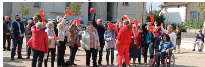
L'AEV interprétant "Le chiffon rouge"

N'oublions jamais que c'est par les luttes des travailleurs que toutes les avancées sociales ont été conquises, c'est par leurs luttes qu'elles seront sauvegardées.