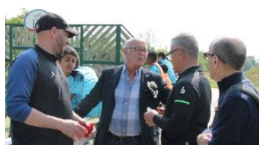
Le Maire discute avec les coaches du club de foot