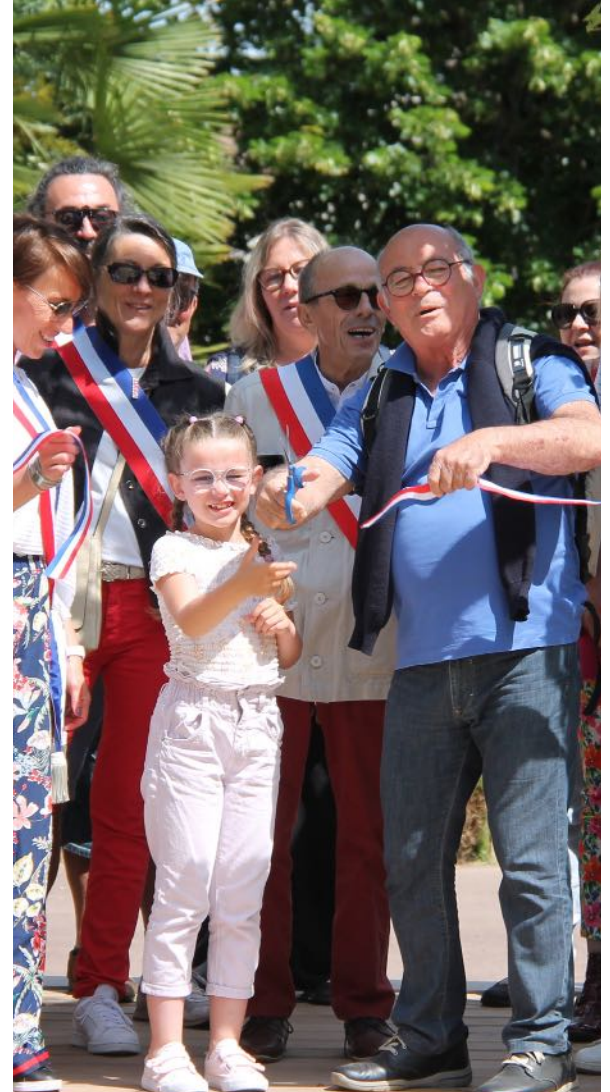
Le théâtre de verdure inauguré