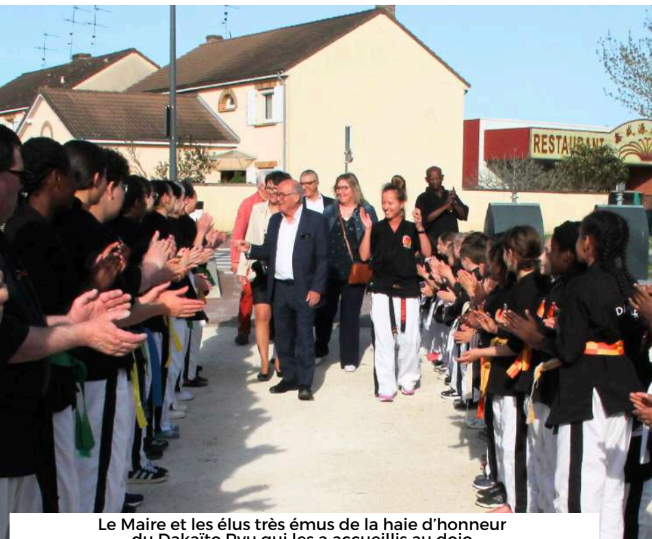
Le Maire et les élus très émus de la haie d'honneur du Dakaïto Ryu qui les a accueillis au dojo