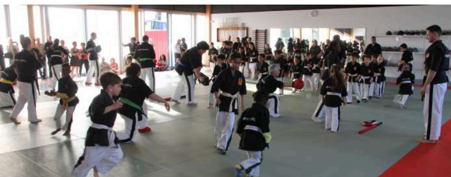
Démonstration des enfants adhérents au club de Dakaïto Ryu et au club de judo