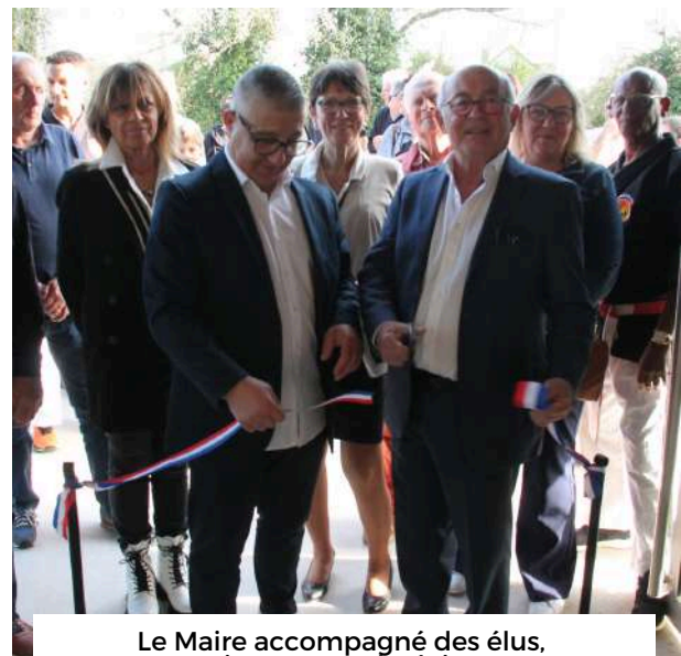
Le Maire accompagné des élus, inaugurant le dojo