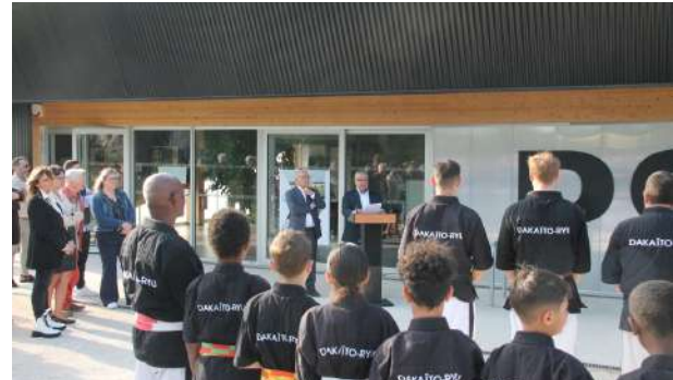
... devant un public attentif