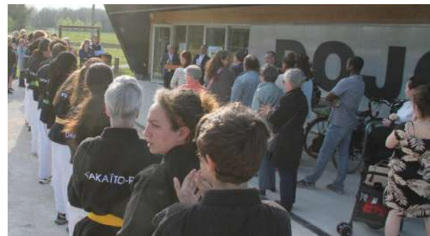
La haie d'honneur