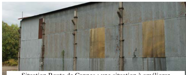
Situation Route de Cannes : une situation à améliorer