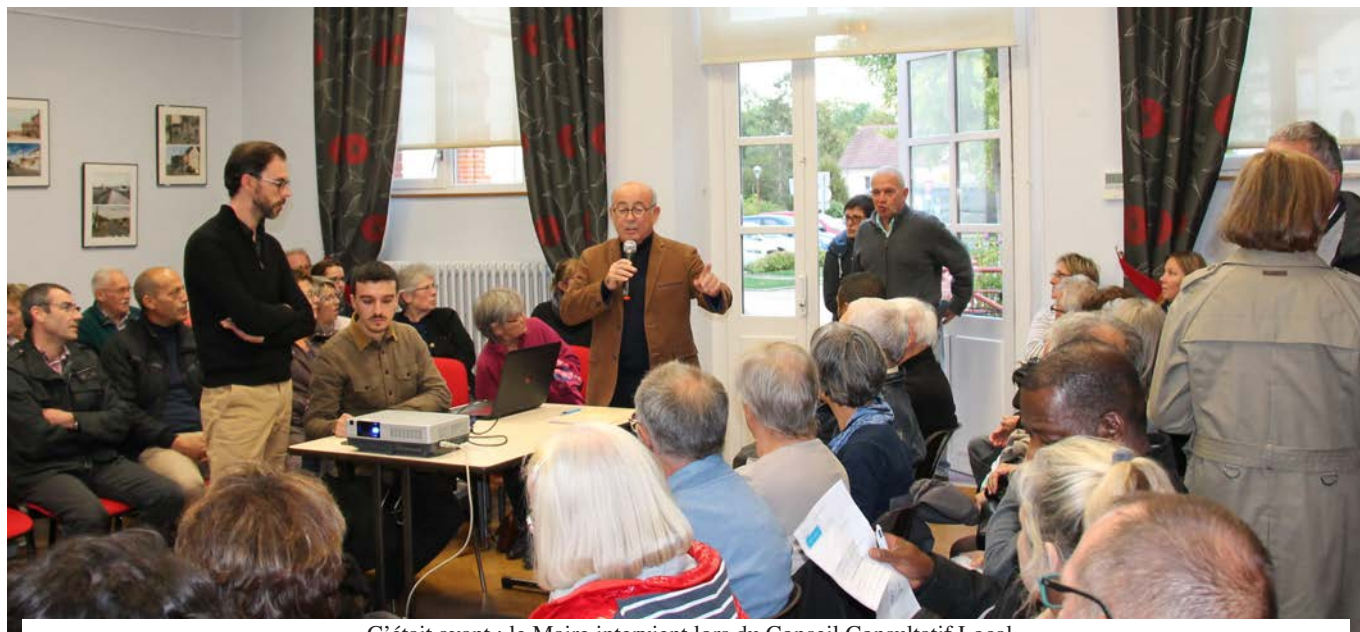
C'était avant : le Maire intervient lors du Conseil Consultatif Local

Pourtant les communes se sont révélées aux yeux de tous comme les meilleurs acteurs de la solidarité de proximité ? C'est pourquoi, avec d'autres Maires, je demande un grand texte pour remettre les communes à leur place en leur redonnant plus de pouvoirs. Nous devons être investis de nouvelles compétences assorties de nouveaux moyens. C'est à cette condition que nous pourrons aider notre pays à sauver ses entreprises (les plus petites...) et ses emplois. C'est l'investissement dans la Transition Energétique qui doit être la moëlle épinière de cette nouvelle politique. Encore une fois, ce qu'il manque, c'est une vision pour espérer et une réelle volonté de transformer.